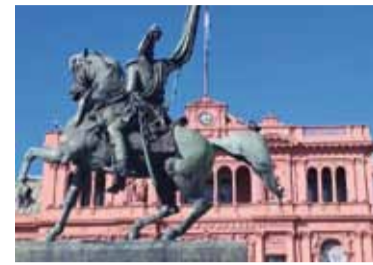
No fluyen los fondos. Desde la Casa Rosada.

Un informe reveló que los envíos de coparticipación, leyes especiales y compensaciones sumaron $5,05 billones en marzo.