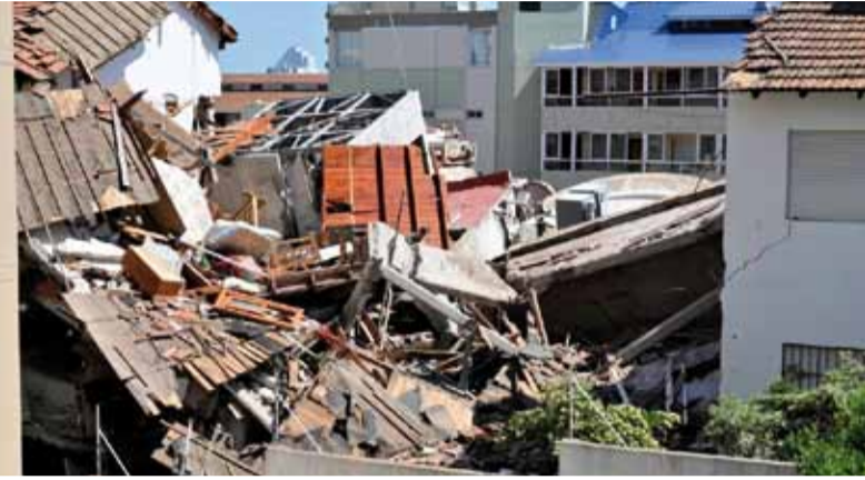
El derrumbe. Del Apart Hotel Dubrovnik en Villa Gesell

Por el hecho ocurrido en 2024 fallecieron nueve personas y se señalaron posibles responsabilidades administrativas