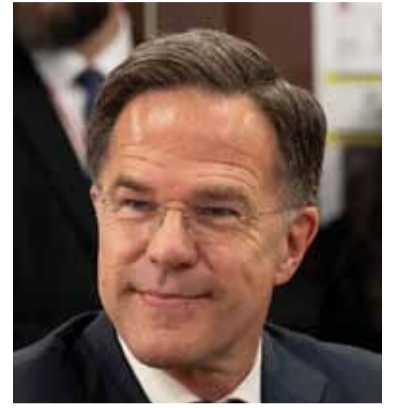
Difícil encomienda. Para Mark Rutte

Rutte también espera dialogar con el secretario de Estado, Marco Rubio, y con el secretario de Defensa, Pete Hegseth.