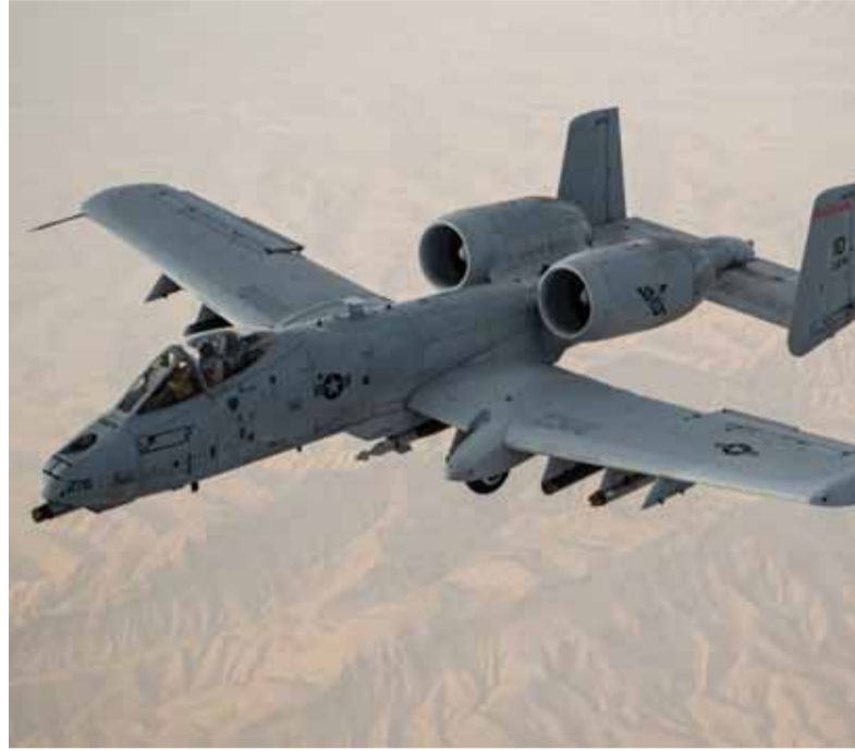
A-10 Warthog. Similar a uno de los aviones derribados en Irán

El F-15E es un avión que puede llevar a cabo misiones aire-aire y aire-tierra y normalmente están tri-