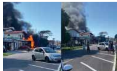
Tragedia. Cayó una aeronave sobre un inmueble en sur de Brasil

ron controlar el incendio, y la zona permanece acordonada para las labores de extinción.