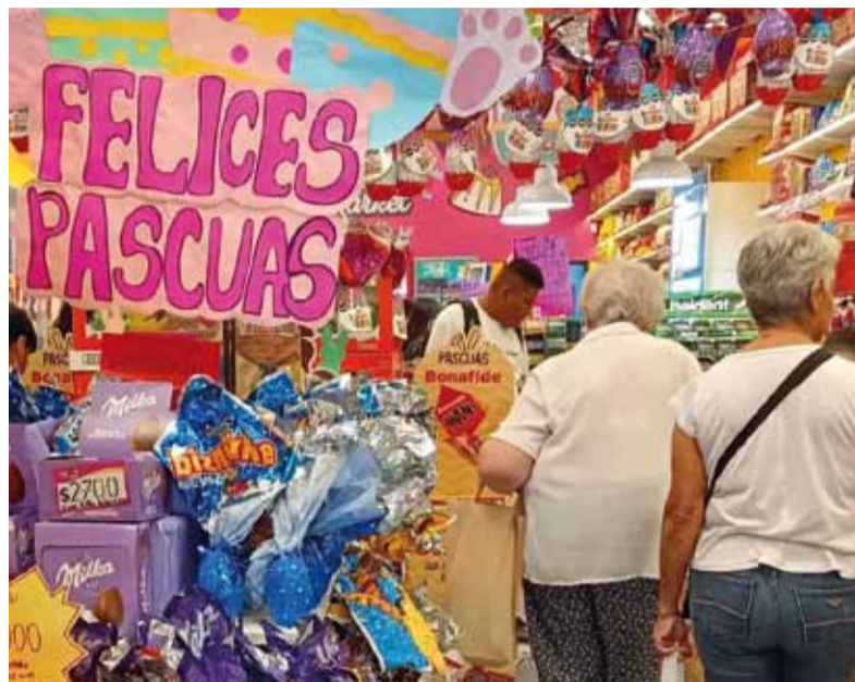
Fuerte impacto. De los precios en la conmemoración de Semana Santa.

La suba más alta se vio en la rosca artesanal de 500 gramos,