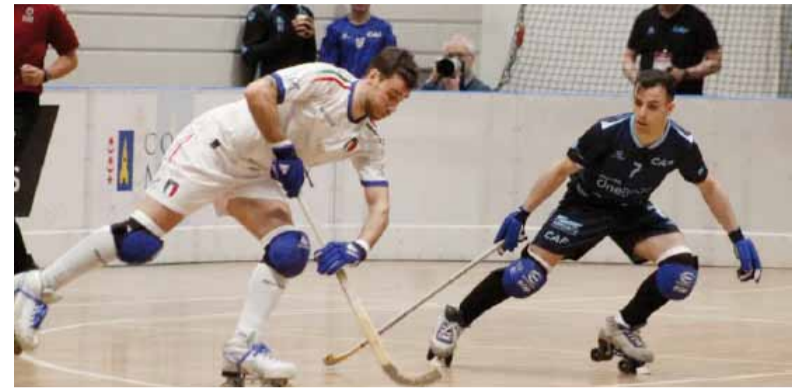
A levantar. La Albiceleste defiende el título en Suiza.

Fue por 5-2 en la última jornada de la fase de grupos de la Copa de las Naciones. Desde las 14 enfrenta a Portugal por un lugar en la final.