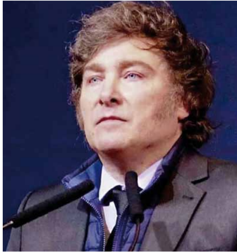
Campaña en su contra. Milei pidió identificar a todos los involucrados.

Según esos registros, entre junio y octubre de 2024 la red habría